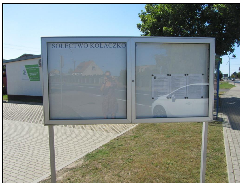
Tablica informacyjna sołectwa

SOLECKA STRATEGIA ROZWOJU – wsi KOŁACZKOWO wypracowana przez GOW na warsztatach w ramach programu UMWW - „Wielkopolska Odnova Wsi 2020+”