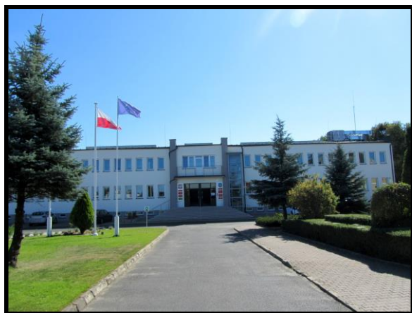
Urząd Gminy Kołaczkowo