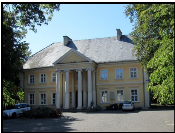
Pałac Wł. St. Reymonta