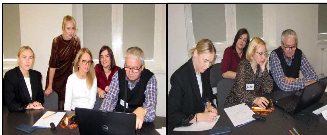
Grupa Odnovy Wsi w czasie warsztatów opracowania Sołeckiej Strategii Rozwoju Sala Sesyjna Urzędu Gminy w Kołaczkowie w dniach 18-19.X.2024 r.

SOLECKA STRATEGIA ROZWOJU – wsi KOŁACZKOWO wypracowana przez GOW na warsztatach w ramach programu UMWW - „Wielkopolska Odnova Wsi 2020+”