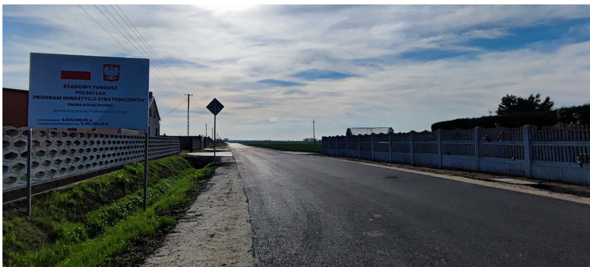
Budowa drogi gminnej ul. Szerokiej w Kołaczkowie