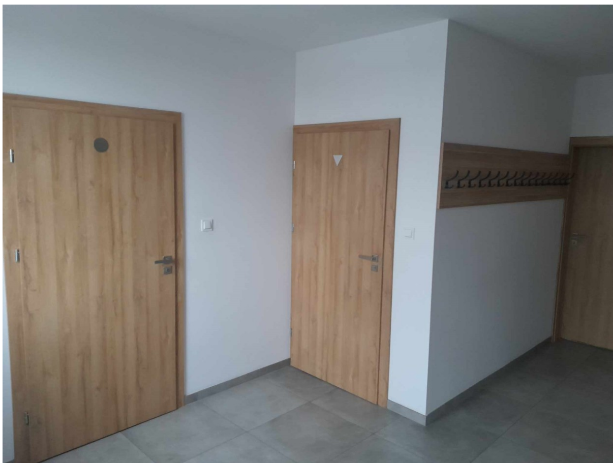
Modernizacja świetlicy wiejskiej w Żydowie