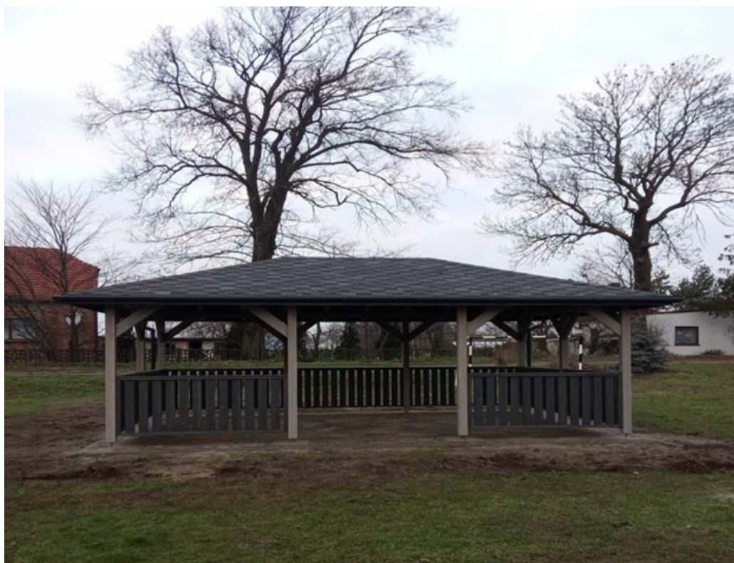
Budowa altany w Krzywej Górze, dz. nr 134/10