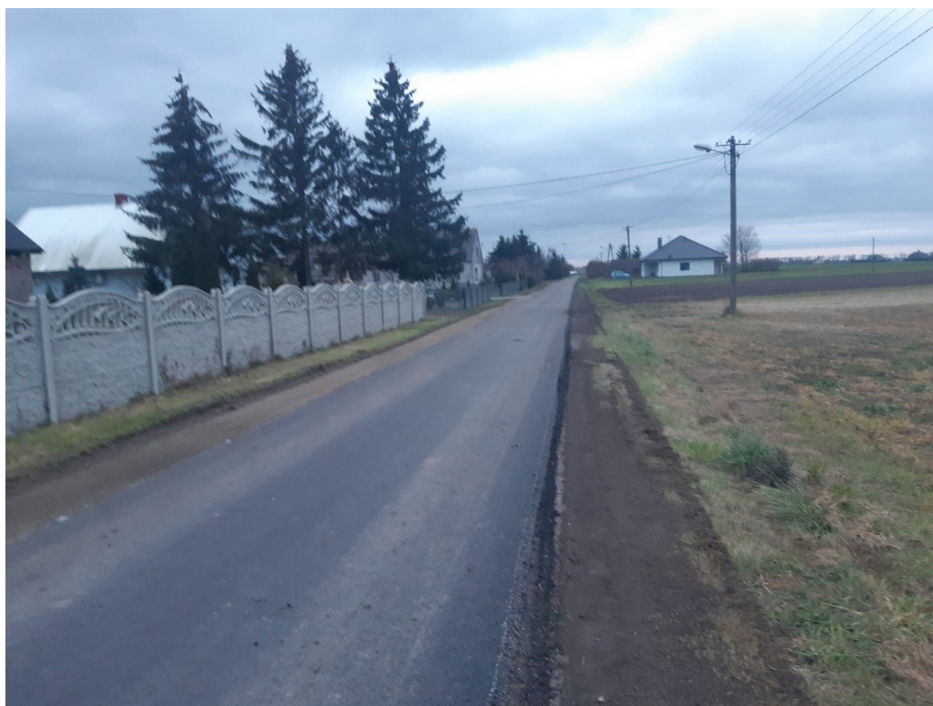
Remont nawierzchni drogi gminnej w miejscowości Zieliniec dz. nr 109 obręb Zieliniec oraz dz. Nr 37 obręb Żydowo – droga o długości 978m