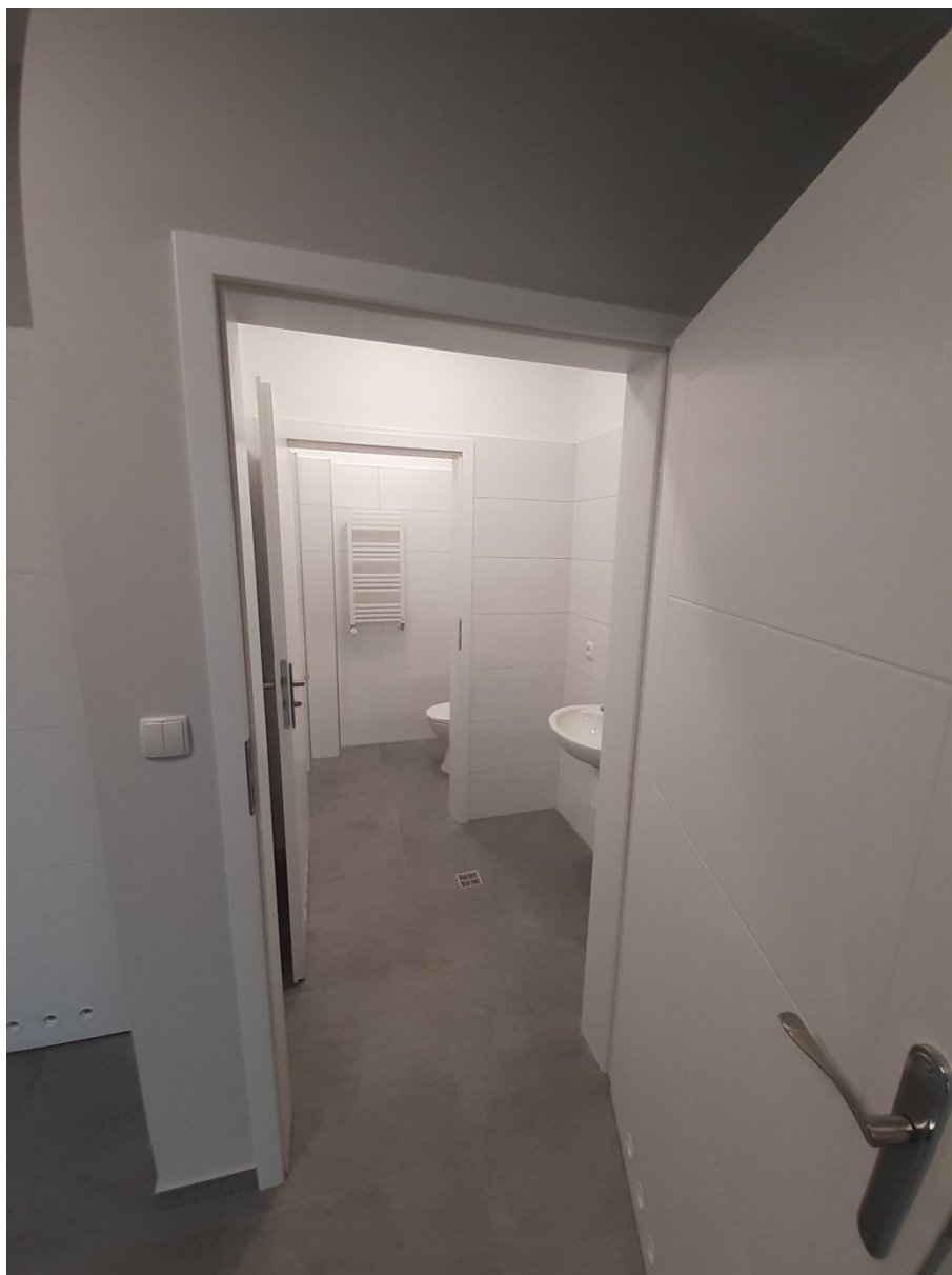
Dobudowa toalet do budynku świetlicy wiejskiej i remizy OSP w Sokolnikach