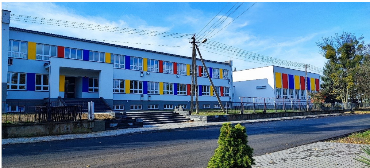
Przebudowa budynku Szkoły Podstawowej w Bieganowie wraz z dociepleniem ścian zewnętrznych w ramach termomodernizacji budynku