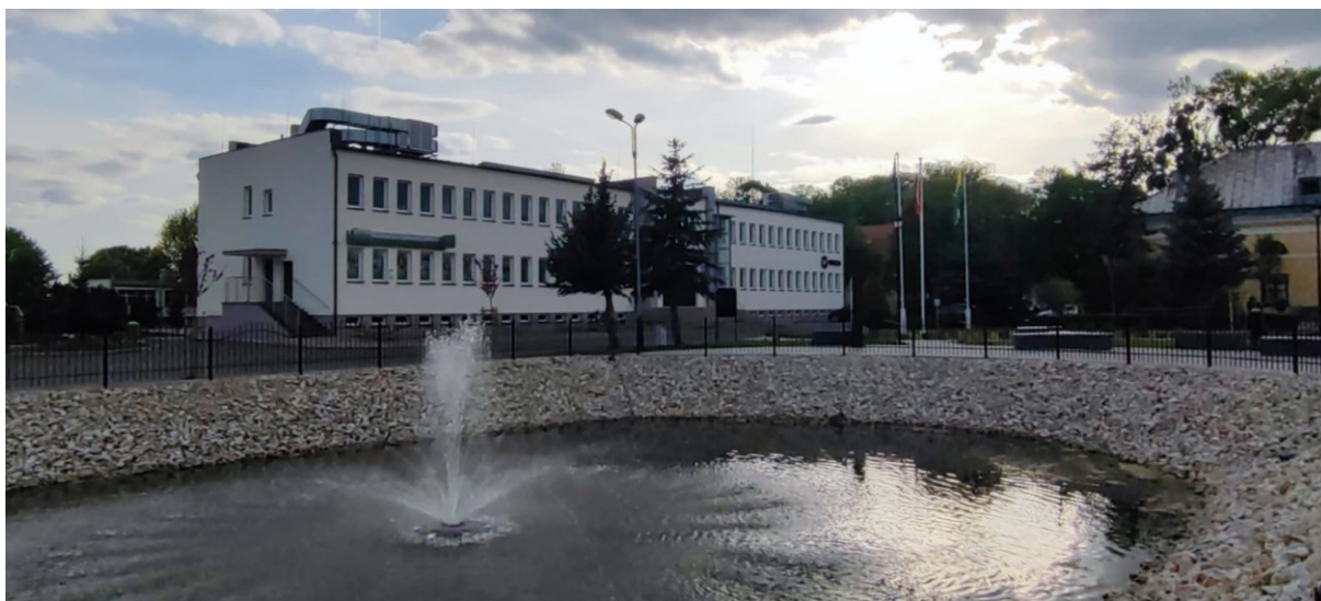
Zagospodarowanie miejsca rekreacji wraz ze stawkiem przy Urzędzie Gminy w Kołaczkowo