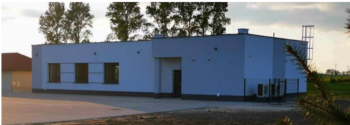
Budowy świetlicy wiejskiej w Grabowie Królewskim