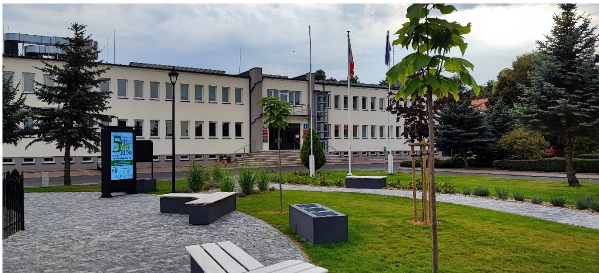
Zagospodarowanie miejsca rekreacji wraz ze stawkiem przy Urzędzie Gminy w Kołaczkowo