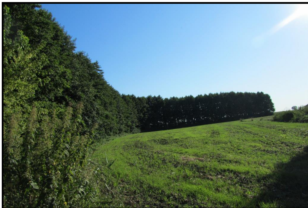
Walory przyrodnicze sołectwa

SOŁECKA STRATEGIA ROZWOJU – wsi CIEŚLE MAŁE wypracowana przez GOW na warsztatach w ramach programu UMWW - „Wielkopolska Odnowa Wsi 2020+”