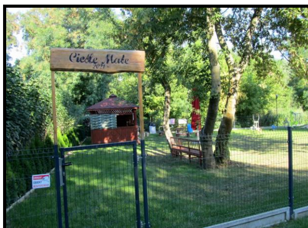
Miejsce spotkań i integracji mieszkańców „Dołek pod wierzbą”