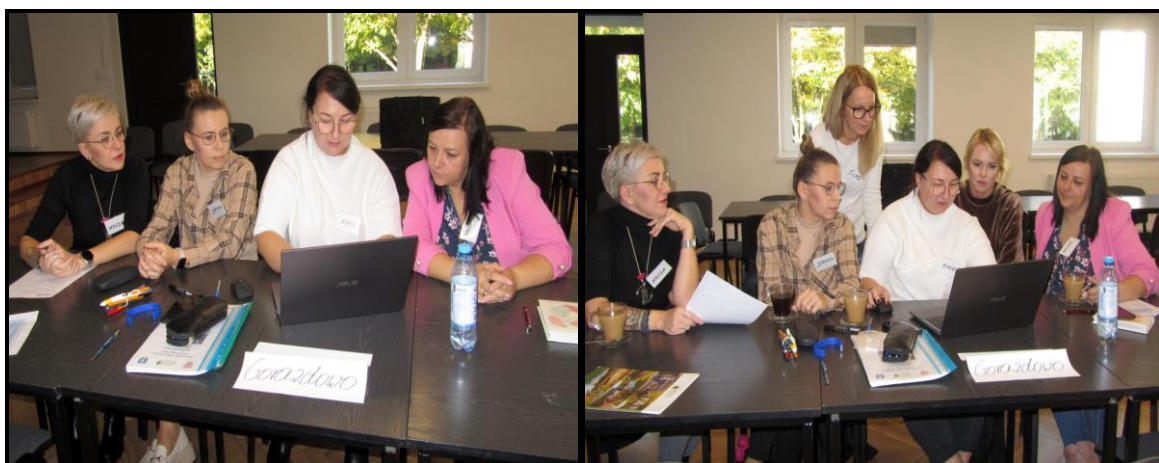
Grupa Odnovy Wsi w czasie warsztatów opracowania Sołeckiej Strategii Rozwoju Sala Sesyjna Urzędu Gminy w Kołaczku w dniach 18-19 X 2024 r.

SOLECKA STRATEGIA ROZWOJU – wsi GORAZDOWO wypracowana przez GOW na warsztatach w ramach programu UMWW - „Wielkopolska Odnova Wsi 2020+”