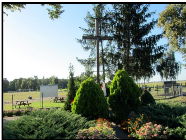
Miejsce kultu religijnego