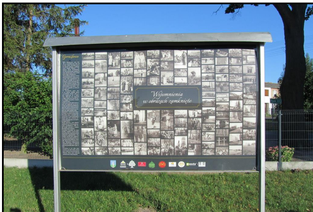
Tablica promująca sołectwo – Wspomnienia w obrazach zamknięte

ZASOBY – wszelkie elementy materialne i niematerialne wsi i związanego z nią obszaru, które mogą być wykorzystane obecnie badź w przyszłości w realizacji publicznych bądź prywatnych przedsięwzięć odnowy wsi. Zwrócić uwagę na elementy specyficzne i rzadkie (wyróżniające wieś). Opracowanie: Ryszard Wilczyński