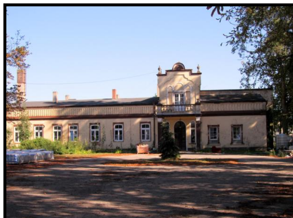
Dwór z pocz. XX w