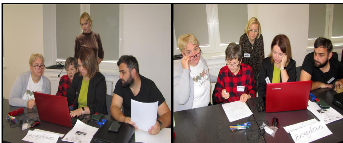
Grupa Odnowy Wsi w czasie warsztatów opracowania Sołeckiej Strategii Rozwoju Sala Sesyjna Urzędu Gminy w Kołaczku w dniach 18-19.X.2024 r.

SOLECKA STRATEGIA ROZWOJU – wsi BORZYKOWO wypracowana przez GOW na warsztatach w ramach programu UMWW - „Wielkopolska Odnowa Wsi 2020+”