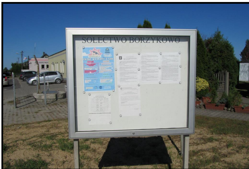
Tablica informacyjna sołectwa

SOŁECKA STRATEGIA ROZWOJU – wsi BORZYKOWO wypracowana przez GOW na warsztatach w ramach programu UMWW - „Wielkopolska Odnowa Wsi 2020+”