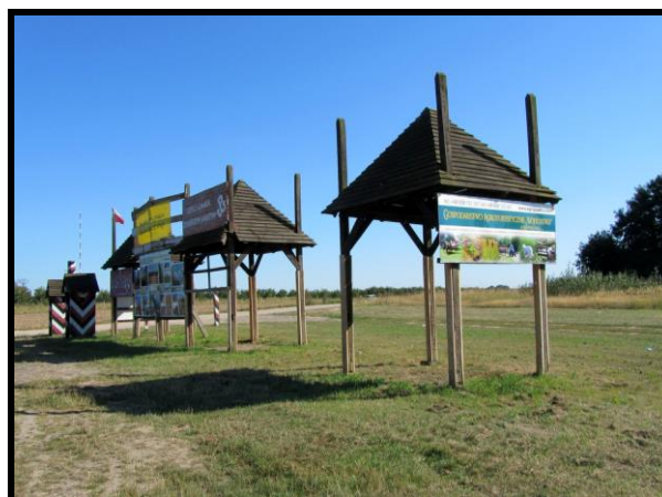
Rekonstrukcja – skansen Przejsie graniczne dzielące Cesarstwo Rosyjskie i Niemieckie