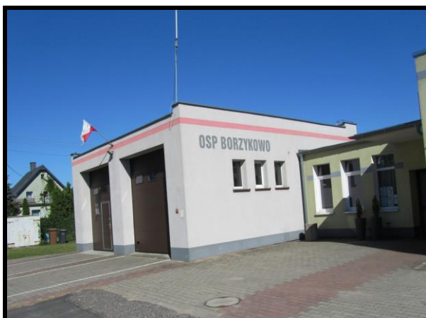
OSP oraz Świetlica wiejska