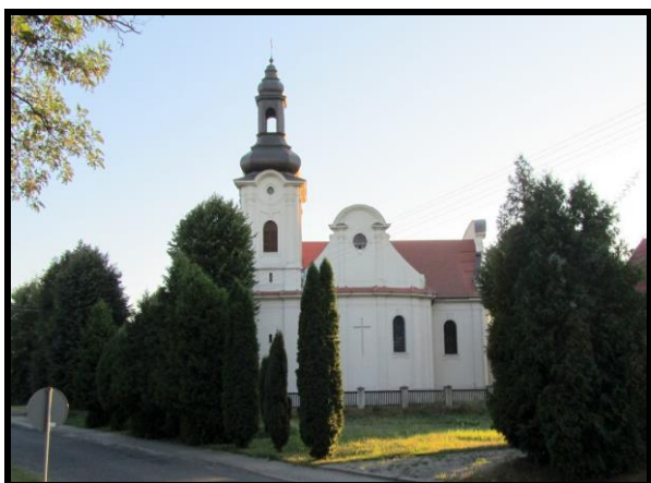
Kościół pw. Św. Jakuba Więszego Apostoła