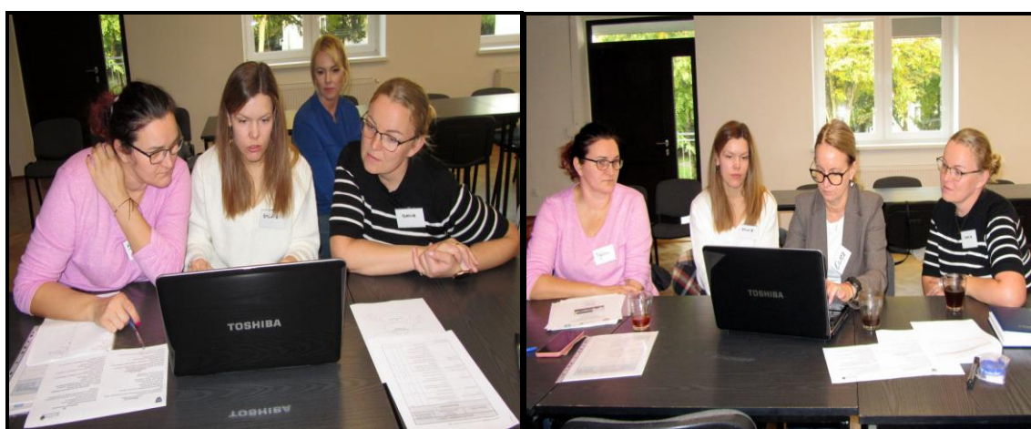
Grupa Odnovy Wsi w czasie warsztatów opracowania Sołeckiej Strategii Rozwoju Sala Sesyjna Urzędu Gminy w Kołaczku w dniach 18-19.X.2024 r.

SOLECKA STRATEGIA ROZWOJU – wsi SOKOLNIKI wypracowana przez GOW na warsztatach w ramach programu UMWW - „Wielkopolska Odnova Wsi 2020+”