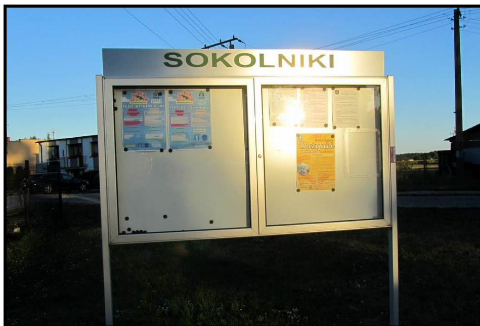
Tablica informacyjna sołectwa

SOŁECKA STRATEGIA ROZWOJU – wsi SOKOLNIKI wypracowana przez GOW na warsztatach w ramach programu UMWW - „Wielkopolska Odnowa Wsi 2020+”