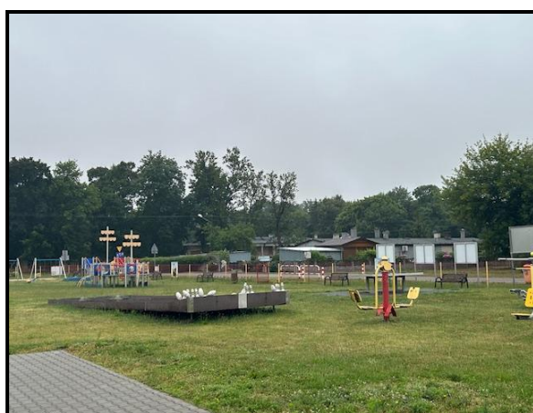
Miejsce sportu i rekreacji

SOLECKA STRATEGIA ROZWOJU – GRABOWO KRÓLEWSKIE wypracowana przez GOW na warsztatach w ramach programu UMWW – „Wielkopolska Odnowa Wsi 2020+”