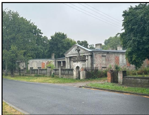
Ruiny zabytkowego pałacu Wilkoszewskich