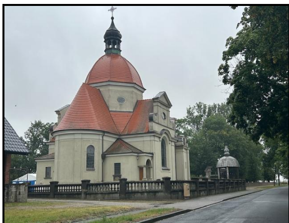
Kościół pw. Najświętszego Serca Pana Jezusa