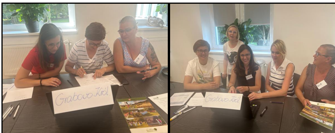
Grupa Odnowy Wsi w czasie warsztatów opracowania Sołeckiej Strategii Rozwoju Sala Sesyjna Urzędu Gminy w Kołaczku w dniach 05-06.09.2025 r.

SOLECKA STRATEGIA ROZWOJU – GRABOWO KRÓLEWSKIE wypracowana przez GOW na warsztatach w ramach programu UMWW - „Wielkopolska Odnova Wsi 2020+”