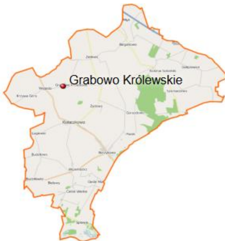
Położenie sołectwa na terenie gminy Kołaczek