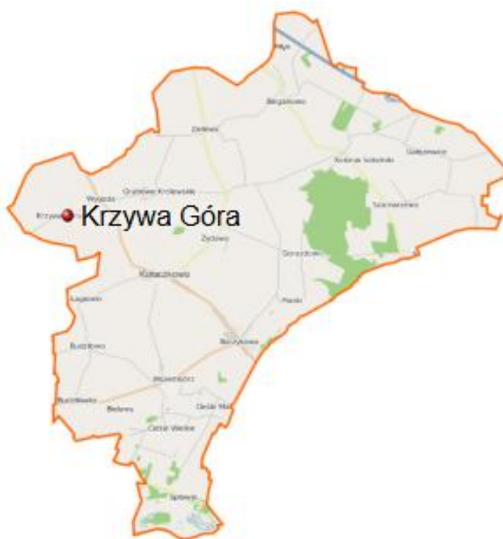
Położenie sołectwa na mapie gminy Kołaczekowo