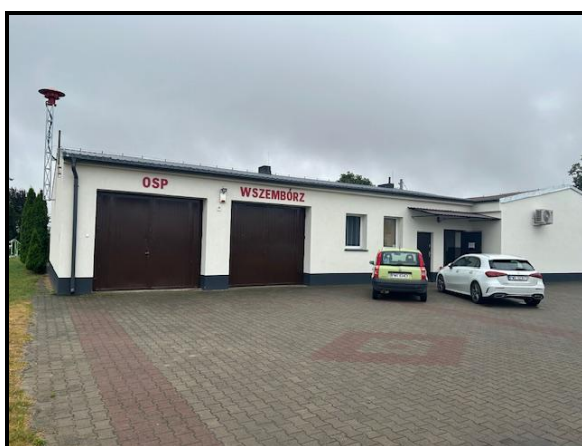
OSP oraz Świetlica wiejska