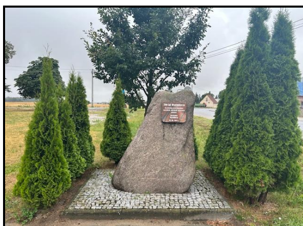
Tablica pamiątkowa 700 lecie Wszemborza

SOLECKA STRATEGIA ROZWOJU – WSZEMBÓRZ wypracowana przez GOW na warsztatach w ramach programu UMWW – „Wielkopolska Odnowa Wsi 2020+”