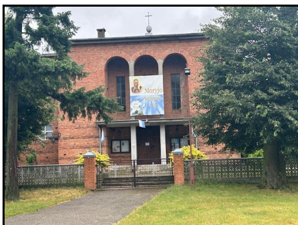
Kościół pw. Świętego Mikołaja