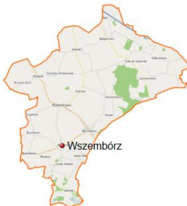
Położenie sołectwa na mapie gminy Kołaczekowo