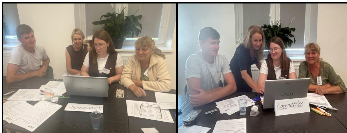
Grupa Odnowy Wsi w czasie warsztatów opracowania Sołeckiej Strategii Rozwoju Sala Sesyjna Urzędu Gminy w Kołaczku w dniach 05-06.09.2025 r.

SOLECKA STRATEGIA ROZWOJU – WSZEMBÓRZ wypracowana przez GOW na warsztatach w ramach programu UMWW - „Wielkopolska Odnowa Wsi 2020+”