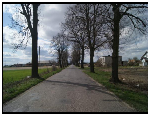
Aleja lipowa i kasztanowa