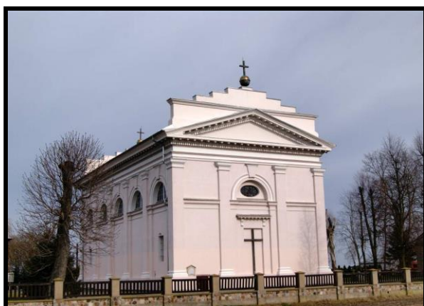
Kościół p.w. Świętych Apostołów Szymona i Judy Tadeusza