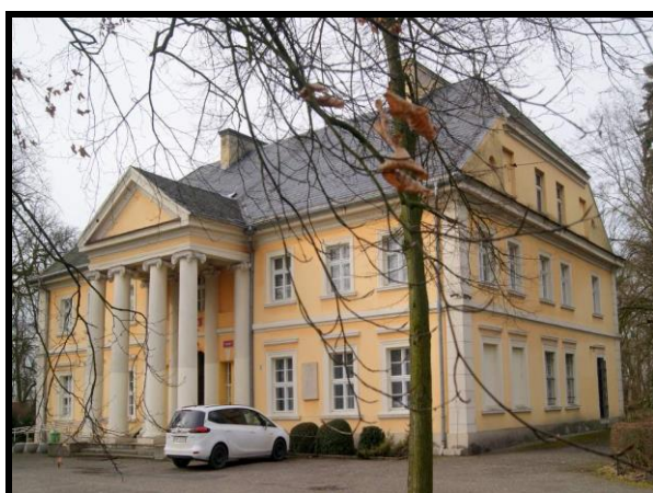
Pałac Wł. St. Reymonta