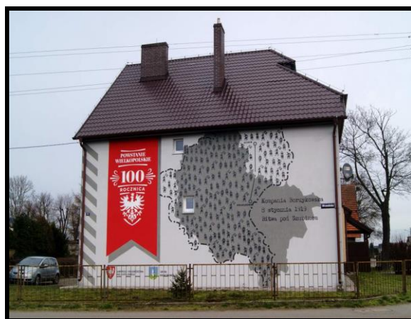
Żywa pamięć o lokalnych bohaterach