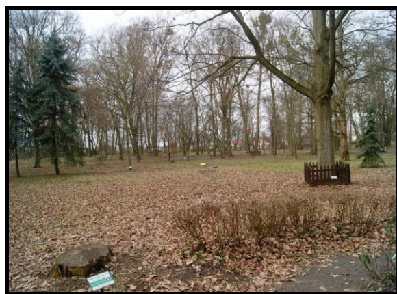
Park z cennym drzewostanem