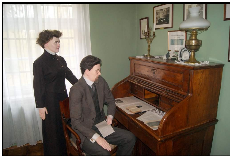
Izba pamięci Wł. St. Reymonta z cennymi eksponatami

SOŁECKA STRATEGIA ROZWOJU – KOŁACZKOWO wypracowana przez GOW na warsztatach w ramach programu UMWW - „Wielkopolska Odnowa Wsi 2013-2020”