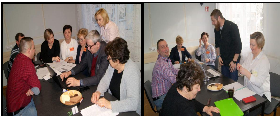
Grupa Odnowy Wsi w czasie warsztatów opracowania Sołeckiej Strategii Rozwoju. Sala Sesyjna Urzędu Gminy w Kołaczkwie w dniach 28-29.II.2020r.

SOŁECKA STRATEGIA ROZWOJU – KOŁACZKOWO wypracowana przez GOW na warsztatach w ramach programu UMWW - „Wielkopolska Odnowa Wsi 2013-2020”