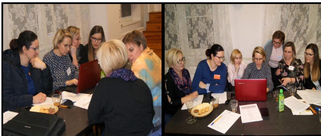
Grupa Odnowy Wsi w czasie warsztatów opracowania Sołeckiej Strategii Rozwoju. Sala Sesyjna Urzędu Gminy w Kołaczku w dniach 28-29.II.2020r.

SOLECKA STRATEGIA ROZWOJU – SOKOLNIKI wypracowana przez GOW na warsztatach w ramach programu UMWW - „Wielkopolska Odnowa Wsi 2013-2020”