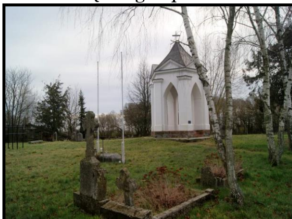
Zabytkowy cmentarz ewangelicki