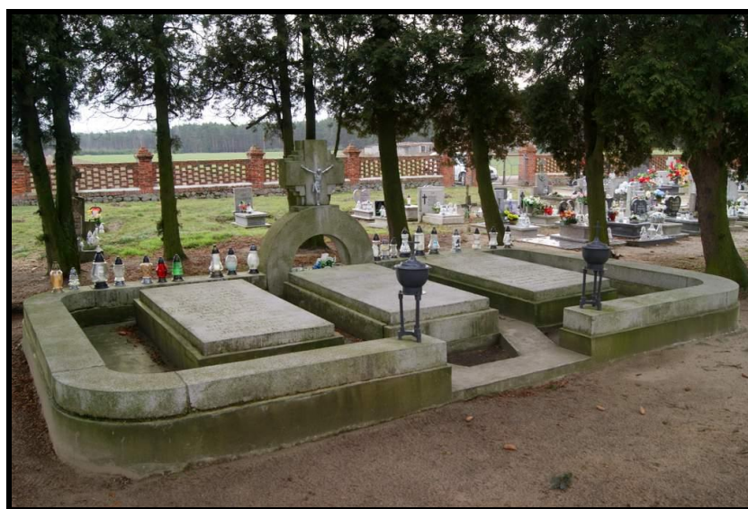
Żywa pamięć o lokalnych bohaterach