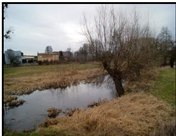
Dolina rzeki Wrześnicy