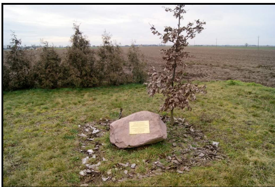
Dąb Wolności posadzony przez OSP z inicjatywy Prezydenta RP Bronisława Komorowskiego

SOLECKA STRATEGIA ROZWOJU – GORAZDOWO wypracowana przez GOW na warsztatach w ramach programu UMWW - „Wielkopolska Odnowa Wsi 2013-2020”