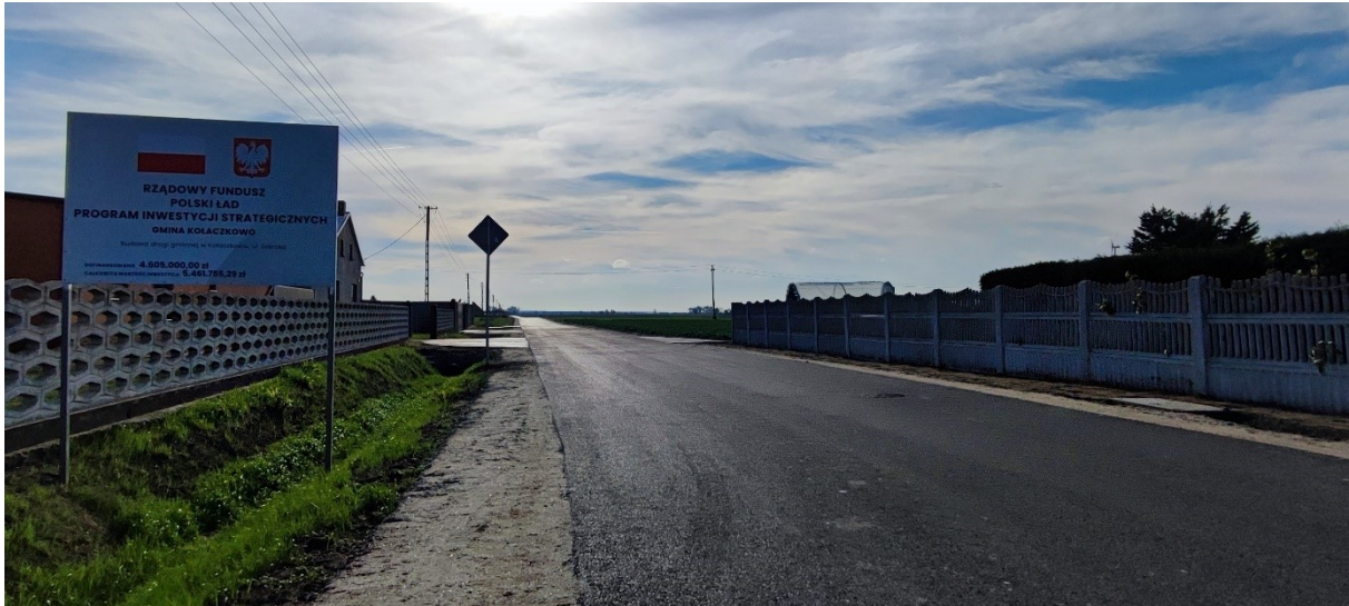
Budowa drogi gminnej ul. Szerokiej w Kolaczkowie